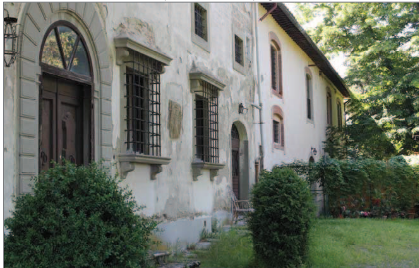
Villa Lisi: vista parziale della facciata