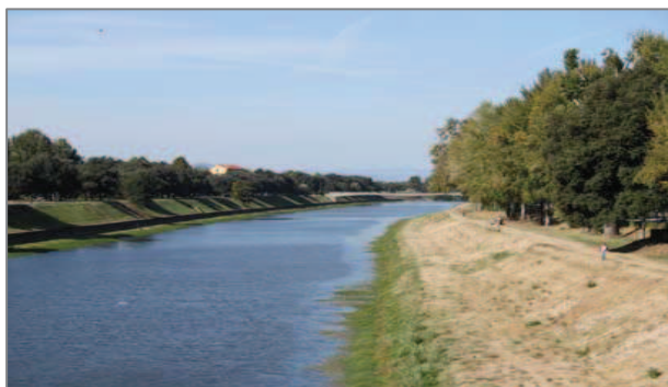
Alle Cascine, lungo il fiume