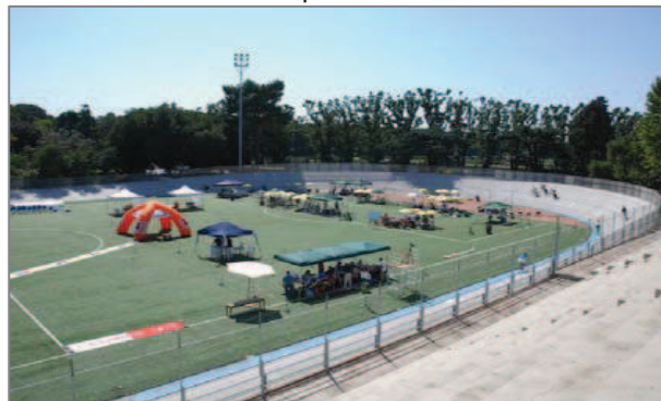
Uno degli impianti sportivi: il velodromo

Al suo interno 35 ettari di bosco popolati da poco meno di 20.000 alberi: in origine soprattutto farnie, olmi, aceri campestri e ornielli (testimoni dell'antica foresta planizaria che occupava i fertili terreni alluvionali), cui nel tempo si sono aggiunte specie largamente diffuse in area urbana quali, tra gli altri, ailanti, sambuchi, pini, bagolari, frassini, tigli, lecci e platani. Noto il patrimonio arboreo "storicizzato", in cui spiccano i cedri dell'Atlante nel Piazzale Vittorio Veneto e il ginkgo biloba nel Piazzale delle Cascine.