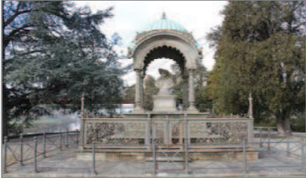
Il Monumento all'Indiano alle Cascine