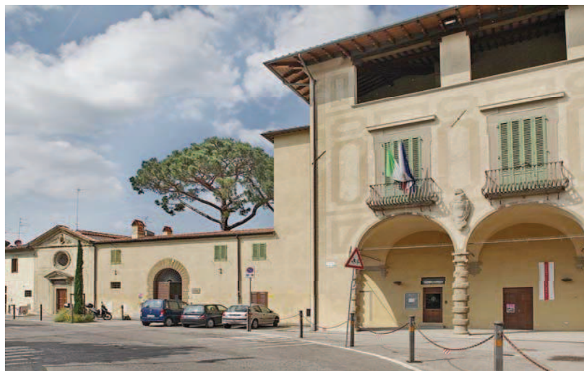
Villa Vogel: prospetto su Via delle Torri

Prendendo a sinistra Viuzzo del Crocifisso delle Torri (prende nome da un tabernacolo con crocifisso - mal conservato - vicino a Villa Le Torri, oggi Villa Vogel) si giunge a Via delle Torri (prende anch’essa il nome da Villa Le Torri, oggi Vogel ).