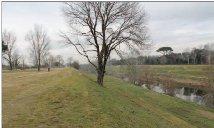
Il paesaggio, via via, si fa meno antropizzato

All'intersezione con via dell'Argingrosso il paesaggio si fa meno antropizzato, riguadagnando in parte il suo aspetto originario, quello fatto di poderi, orti e frutteti. Siamo qui nella cassa di espansione dell'Arno, il cui progetto preliminare, approvato dal Comune di Firenze, va incontro all' esigenza di creare zone di esondazione controllata nel caso di piene del fiume.