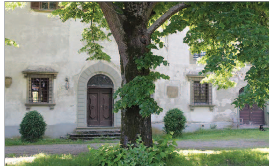
Villa Lisi: parte del giardino