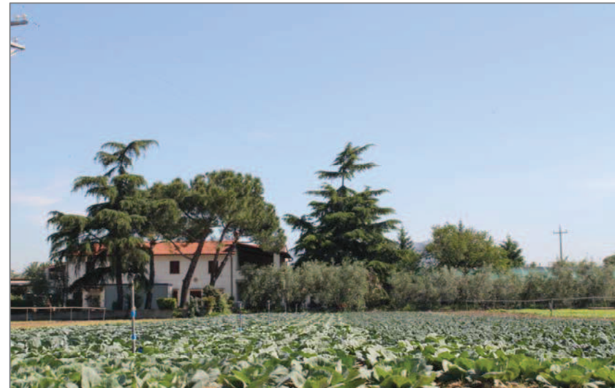
Via del Donicato: la fertilità della terra, a maggio