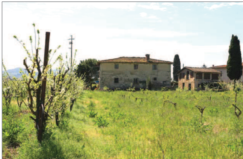
Antica casa colonica nei dintorni del borgo

Percorriamo Via di Ugnano sino a giungere a Via di Fagna . All’incrocio tra le due strade, la Chiesa di Santo Stefano a Ugnano .