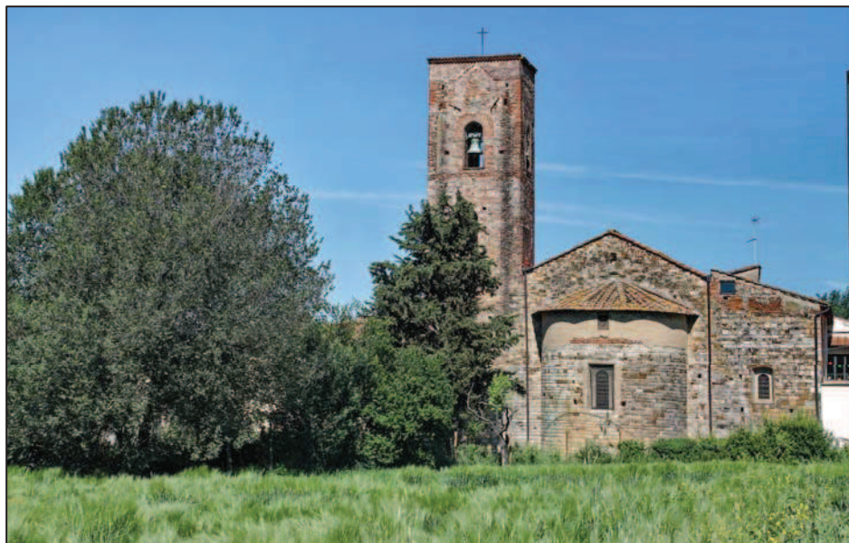
S. Maria a Mantignano: l'abside semicircolare e i bracci del transetto