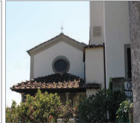
Villa Lisi: part. della cappella (XVII sec.)

Già documentata in epoca medioevale come il "Palagiaccio di Agnano" costituiva, assieme al Castello di Ugnano e alla Badia di Santa Maria a Mantignano, una delle strutture più importanti di tutto questo vasto territorio. L'attuale aspetto risale al XV sec.; di epoca seicentesca è invece la cappella sul fianco della costruzione. Appartenne ai Nerli, agli Andreini (ricchi orafi fiorentini), ai Piccolomini e, alla fine del XVII ai Medici, per passare poi ai Lisi, attuali proprietari.