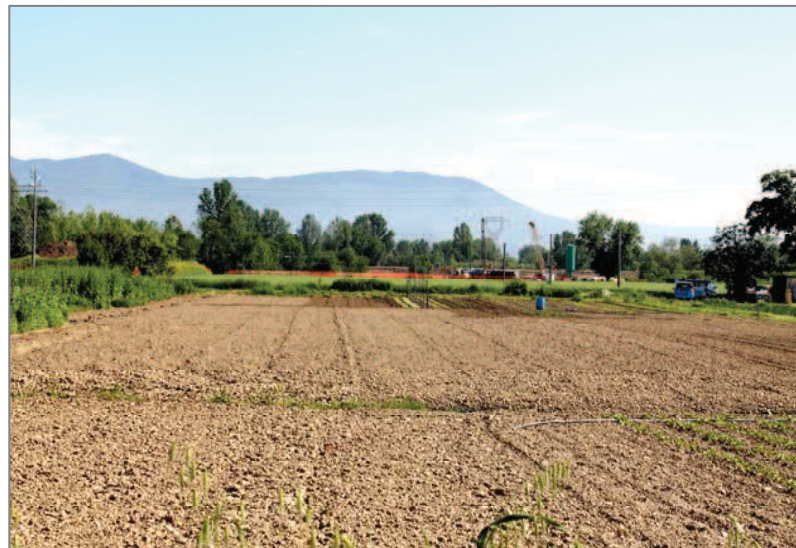
A maggio, i campi arati e dissodati