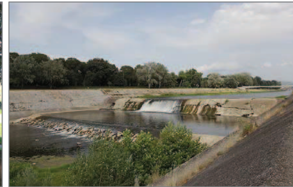
La pescaia dell'Isolotto