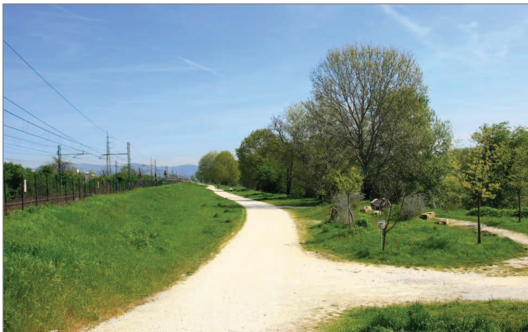
Stradella pedo-ciclabile lungo l'Arno tra Le Piagge e il Ponte all'Indiano

Giunti al termine di Via Campania incrociamo Via San Donnino (in questo tratto molto scarsamente edificata), che imboccheremo a sinistra e percorreremo sino ad incontrare Via della Nave di Brozzi , che prenderemo a destra verso il fiume (il toponimo indica che un tempo, in questa zona, lungo il fiume, era attestata la "nave", cioè il traghetto a collegamento delle due sponde dell'Arno). Al termine, continuiamo sulla stradella pedo - ciclabile lungo l'Arno che corre parallela alla linea ferroviaria e che ci riporta al Ponte all'Indiano.