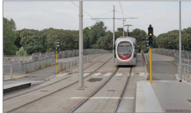
Il ponte della linea 1 della tramvia