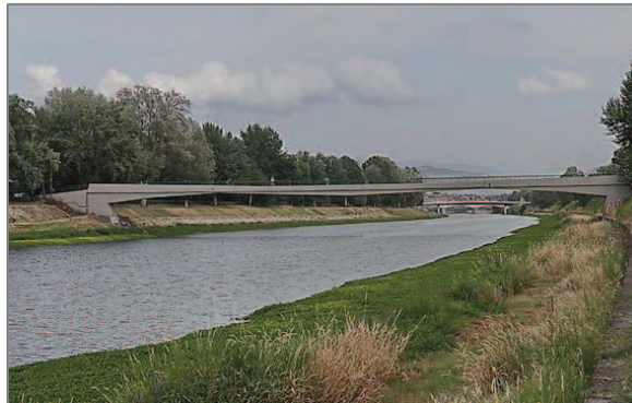
Passerella dell'Isolotto. Sullo sfondo le Cascine

Sempre proseguendo lungo il fiume percorriamo i giardini interni del Lungarno dei Pioppi (dove si apre la passerella pedonale di collegamento al Parco delle Cascine) e di Via dell'Isolotto (con la sua grande pescaia).