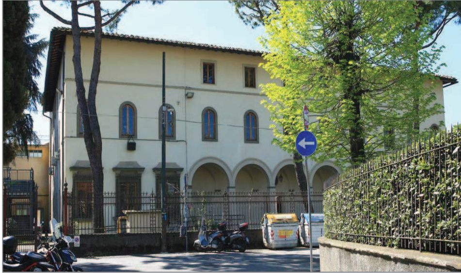
Veduta della facciata di Villa Lo Specchio

Proseguendo, in fondo a Via dell'Agio, proprio davanti a noi, sulla Via di San Bonaventura , la Villa Lo Specchio