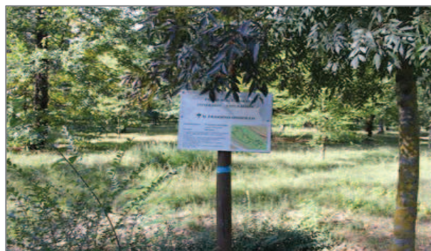
Varietà botaniche: un frassino ossifillo