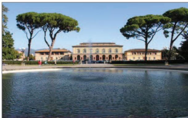
La Palazzina Reale