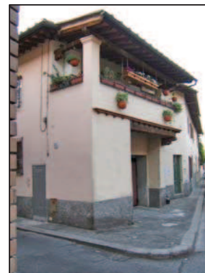
La casa che fu della famiglia Vespucci