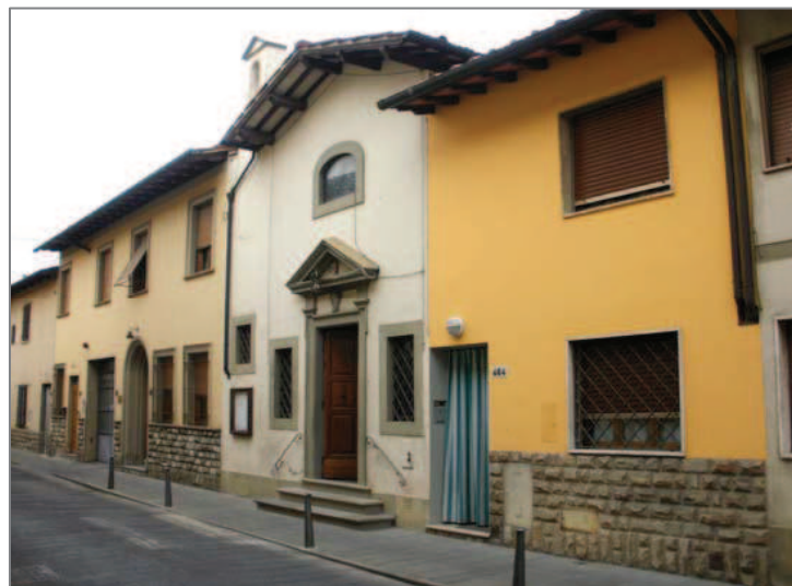
Via di Brozzi : Oratorio della Madonna del Pozzo (inizi XVII sec.). All'interno, "Madonna", affresco del XV sec.