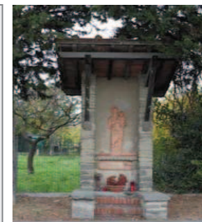
Il tabernacolo del 1950

Oggi è piuttosto difficile “leggere” questo territorio nella sua vera vocazione, a motivo della creazione di infrastrutture di rilievo e di una espansione edilizia spesso non ordinata, ma segni tangibili del suo passato sono, per l’appunto, in questi antichi tracciati e nelle testimonianze di fede ad essi associate.