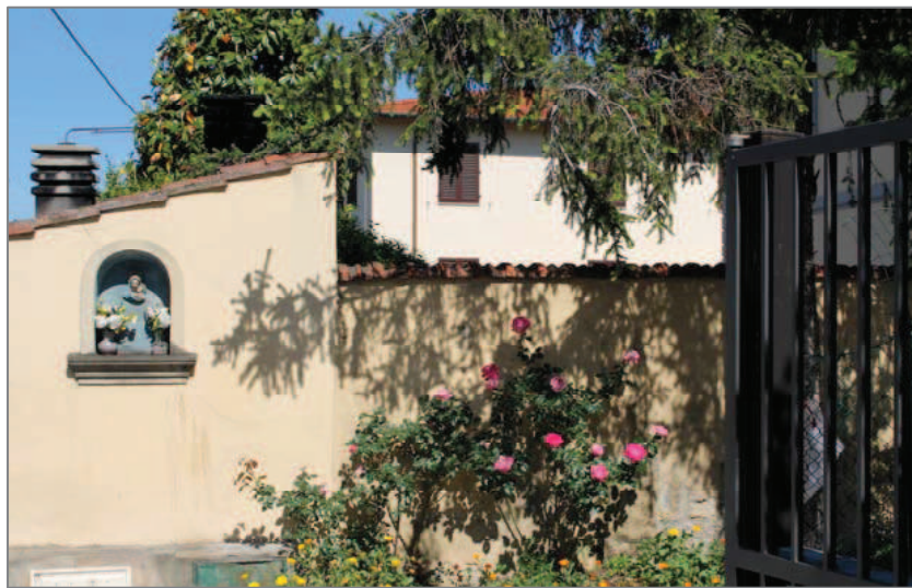
Per la Via di Ugnano

Proseguiamo la nostra strada che ci conduce verso la parte “moderna” del borgo, con le sue villette basse, sino ad incrociare a destra Via di Ugnano , al cui lato, per lungo tratto, corre il muro di confine di una proprietà privata.