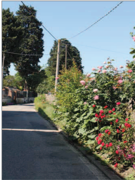
In Via di Fagna

Imbocchiamo adesso, sulla nostra sinistra, Via di Fagna , strada tipica della viabilità minore rurale, che presenta sul fianco destro un lungo muro a secco a confine di terreni coltivati a orto e frutteto. Dopo poco, troviamo - alla nostra sinistra - Via del Donicato (il toponimo deriva dall'aggettivo latino "dominicus", cioè padronale, e quindi significa "terra di proprietà privata non gravata da vincoli feudali") che, via via, accentua il suo carattere tipicamente campestre e agrario, offrendo la vista dell'ordinata distesa dei campi coltivati.