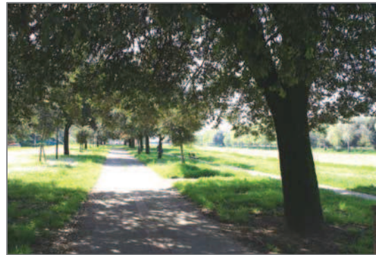
Giardini sul Lungarno