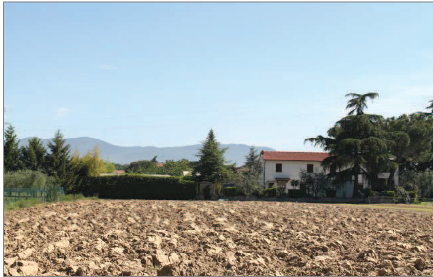
Via del Donicato: i campi dissodati e arati, a maggio