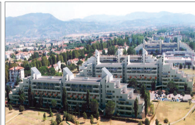
Le Piagge: il complesso detto "le Navi"

Insedimento popolare nato negli anni '80 nell'ambito del Piano Andreatta per rispondere al fabbisogno abitativo seguito a una serie di sfratti che avevano colpito le fasce più deboli della popolazione, sorge nell'area compresa tra la Via Pistoiese, la vecchia linea ferroviaria Firenze - Pisa, l'Autostrada A1 e l'Arno. Questa, un tempo, era la "campagna" degli abitanti "storici" della zona di Via Pistoiese (famosa per la produzione di cocomeri e meloni, a motivo della presenza, nel terreno, di adeguate quantità di sabbia necessaria a questo tipo di coltivazioni). Un'area verde disseminata tuttavia dalle cave di estrazione della rena d'Arno utilizzata per l'edilizia cittadina (che negli anni '60 conosce un vero e proprio boom) e dalle discariche abusive di inerti. Le Piagge - il cui complesso più marcato, dal punto di vista architettonico, è costituito dalle "Navi" - sono da tempo al centro di interventi di riqualificazione tesi a "riammagliare" l'area al contesto circostante (strutturale e infrastrutturale), riqualificandone il tessuto e le connessioni. Importante, a Le Piagge, la presenza di comunità sociali "di base" (cristiane e laiche), impegnate attivamente nell'ascolto del disagio sociale e nel contributo concreto al miglioramento delle condizioni culturali e sociali della popolazione, di cui costituiscono un fondamentale punto di riferimento.