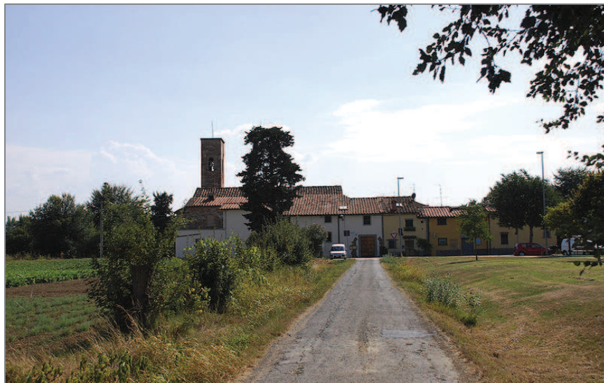
Case nel borgo di Mantignano

Il nostro percorso parte da Via dell'Argingrosso (il toponimo si ricollega alla presenza di un argine di consistenza massiccia eretto per contenere le acque del fiume in caso di grande piena), all'altezza di Via delle Isole. Poco dopo il sottopasso del Viadotto proseguiamo sempre sulla stessa strada che, dopo poche decine di metri, piega a sinistra, assumendo un aspetto diverso, divenendo più stretta e meno trafficata. Di fronte a noi, in lontananza, le colline di Scandicci e ai lati della strada una striscia di campi coltivati o a uso promiscuo, in un paesaggio che alterna bei tratti paesaggistici a elementi di recente urbanizzazione. La strada ci porta adesso all'altezza del Ponte del Fosso degli Ortolani che scavalca la Greve (qui converge, appunto, il "fosso degli ortolani", che attualmente raccoglie le acque reflue degli scarichi del quartiere dell'Isolotto, e che a breve sarà "intubato" e convogliato al nuovo collettore in riva sinistra d'Arno, destinato a far confluire al depuratore di San Colombano tutti gli scarichi della parte fiorentina e bagno a ripolese non ancora collegati). Superato il ponte , ci immettiamo in Via del Ponticino (ponticino, dal vecchio ponte a scavalco del fiume di ben più modeste proporzioni rispetto all'attuale e, al momento, chiuso). Da qui svoltiamo a destra per Via di Mantignano , entrando nel borgo.