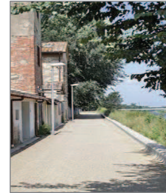
La strada bianca interna a Via Bandinelli

Sempre proseguendo lungo il fiume percorriamo i giardini interni del Lungarno dei Pioppi (dove si apre la passerella pedonale di collegamento al Parco delle Cascine) e di Via dell'Isolotto (con la sua grande pescaia).