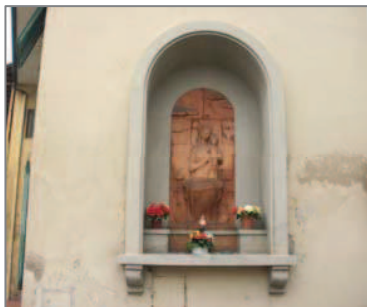
Il tabernacolo di Via dell’Agio

Adesso percorriamo tutta Via di Peretola, con la sua cortina continua di vecchie casette basse. Dopo circa 1 km. la strada prende la denominazione di Via di Brozzi . La percorreremo per ritrovare la stessa tipologia edilizia: la fila continua di case basse con le “corti” interne, comuni e condivise da numerose abitazioni, a testimoniare del tipo di vita e di lavoro un tempo svolti dalla comunità, dedita soprattutto alla lavorazione della paglia e alla coltivazione dei campi (granaglie, canapa e saggina, fieno e gelso), prendendo poi, a destra, a un trivio, per Via dell’Agio (contrassegnata da un tabernacolo votivo , come tipico nelle campagne e nei paesi, ai “crocicchi”), al termine della