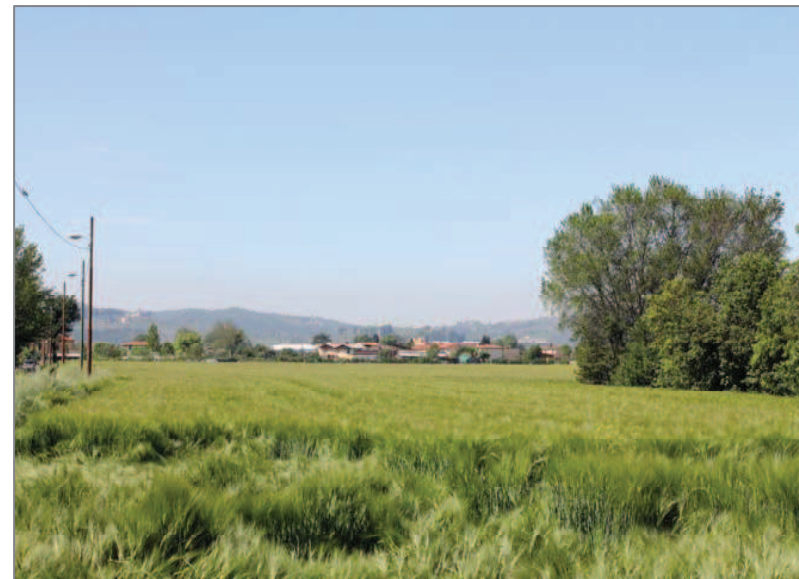
I campi coltivati, ai primi di maggio

L'ingresso al borgo è annunciato dalla vecchia quercia (la "quercia di Mantignano") che gli abitanti non hanno voluto venisse sacrificata al momento della costruzione del nuovo ponte. Lungo la via, villini, piccole palazzine otto-novecentesche, qualche casa colonica e, proseguendo, dove la strada si apre sulla vista dei campi, il profilo della Badia di S. Maria a Mantignano.