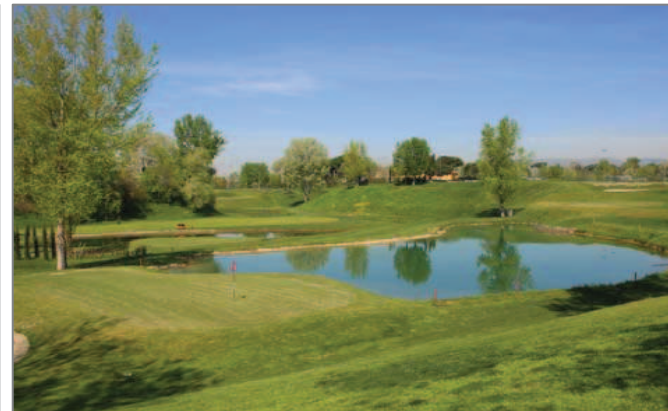
Gli ostacoli d'acqua del campo golf

Poco dopo l'intersezione con Via Carrara si apre un bel campo di golf (attualmente a 9 buche, ne è previsto l'ampliamento a 18), di cui vediamo la parte frontale, quella dedicata al campo pratica, dietro la quale si sviluppa il green. Siamo al confine con il Parco dell'Argingrosso