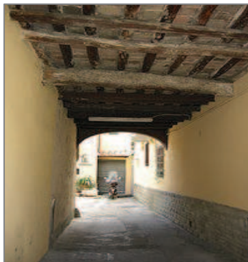
Peretola: passaggio ad arco