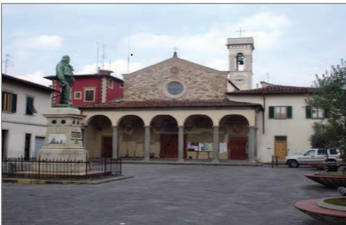
Piazza Garibaldi e la Pieve di S. Maria a Peretola

La zona antica del borgo è caratterizzata da strade strette su cui affacciano file di case "a schiera" (le più antiche – come quella al civico 8 di Via di Peretola appartenuta alla famiglia Vespucci da cui discende il grande navigatore Amerigo - di origine trecentesca, molte del periodo sei-ottocentesco), prive di elementi decorativi, corredate da corti e cortili interni separati dal fronte stradale a mezzo di passaggi ad archi (alcuni dei quali dotati ancora delle antiche travature in legno). Una tipologia insediativa dal carattere suburbano e contadino (la terra fertile qui era coltivata soprattutto a granaglie e la ricchezza del borgo era costituita, anche, dalla lavorazione della paglia, anzi delle trecce per i cappelli di paglia, tanto in voga nell'Otto-Novecento) funzionale alle esigenze di relazione e contiguità tra famiglie.