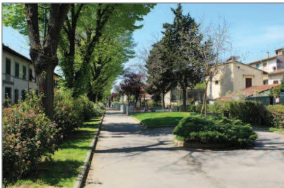
Nei giardini di Via de' Vespucci