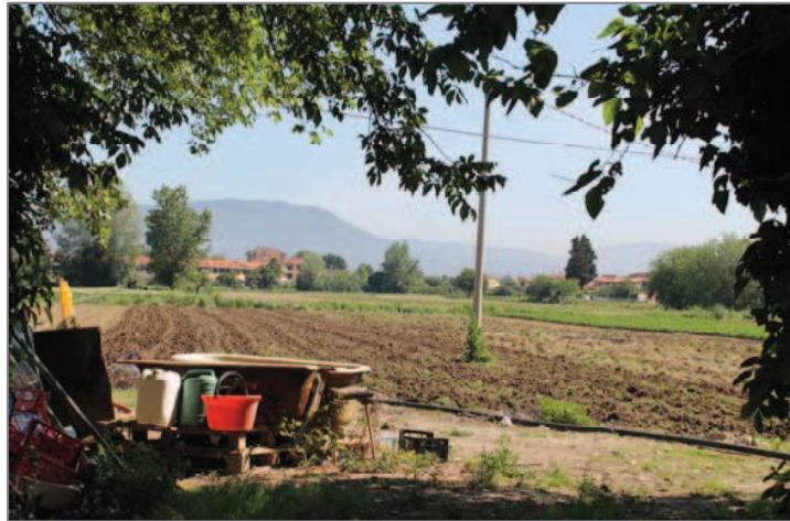
Via del Ferrale: anche qui la bella campagna lavorata

Percorriamo per lungo tratto questa bella strada che ci porta davvero dentro la campagna fertile, ben ordinata e lavorata, quella che ancora ci consente di assaporare sulla nostra tavola gli ortaggi e i frutti di produzione locale, cresciuti in natura. La percorriamo fino ad incontrare, sulla nostra destra, all'altezza delle nuove costruzioni sorte alle spalle di Ugnano (area PEEP), Via del Ferrale (deriva il suo nome dalle antiche coltivazioni di farro). Noi proseguiamo il nostro percorso in campagna, su Via del Ferrale, per incontrare, su di una curva, la bella Villa Lisi (non visitabile).