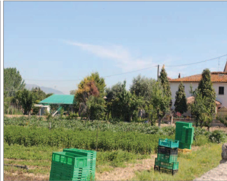
Via del Donicato: pronti per la raccolta degli ortaggi