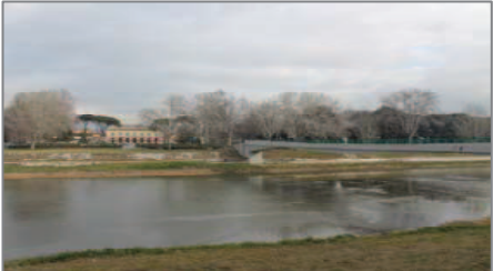
Passerella pedonale dell'Isolotto