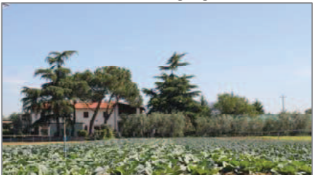
La campagna fertile

Questo percorso, di interesse storico, paesaggistico e ambientale, si svolge a ovest, a valle di Firenze, in riva destra e sinistra d'Arno, tra il Ponte all'Indiano e il Ponte alla Vittoria, attraversando due grandi parchi: quello - storico e monumentale - delle Cascine e quello - più recente - dell'Argingrosso, che assieme costituiscono parte fondamentale del sistema del Parco Metropolitan dell'Arno, in fase di completamento.