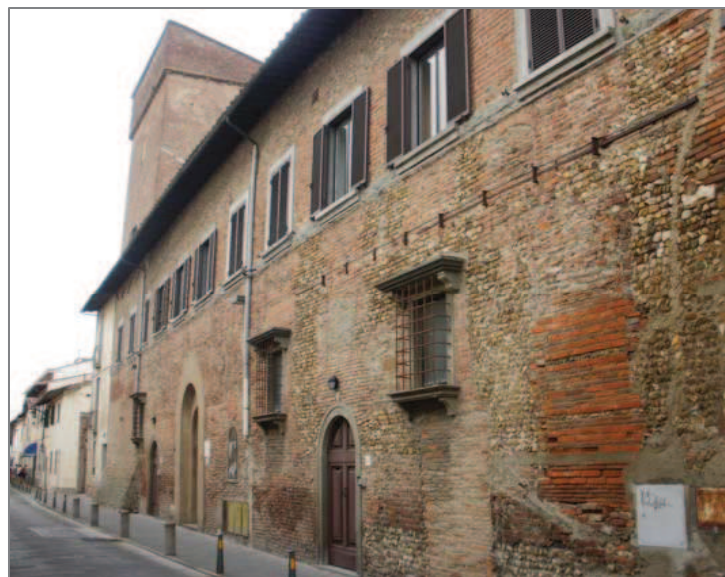
A Brozzi: Palazzo Orsini Baroni, XIII secolo

Famoso per la lavorazione della paglia (attività che, nel Settecento-Ottocento, ne decretò il forte sviluppo economico e demografico e quindi l'espansione urbana) e delle granate di saggina, mantiene ancor oggi viva parte delle sue tradizioni, tra le quali è da annoverare un piatto tipico del luogo: i ranocchi fritti (la pesca dei gamberi e dei granchi in Arno e nei fossi dell'Osmannoro, un tempo attività diffusa, è un ricordo del passato).