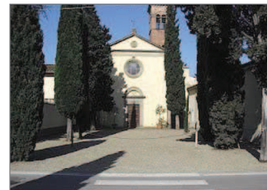
La Pieve di San Martino a Brozzi, nell'omonima via (fuori percorso)

Giunti all'altezza dell'incrocio con Via San Martino a Brozzi, caratterizzato dalla presenza di un'antica costruzione (recentemente ristrutturata, dominata da una torretta), imbocchiamo, sul versante opposto della strada, il Viuzzo della Croce . Percorriamo adesso in tutta la sua lunghezza il Viuzzo sino ad incrociare la Via Pistoiese , che attraverseremo sulle vicine strisce pedonali alla nostra destra.