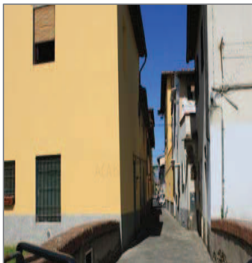
Il ponticello pedonale